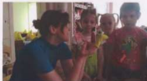
СКАЗКА «ЗМЕЙ ГОРЫНЫЧ»