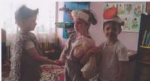
СКАЗКА «МЕШОК ЯБЛОЮ»